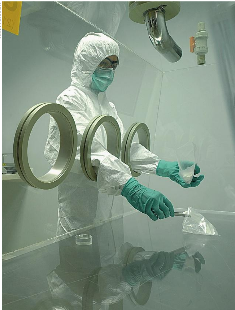
O departamento de Pesquisa e Desenvolvimento da firma é o que regista mais vagas